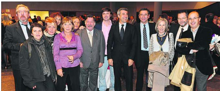
El equipo al completo del Complejo Hospitalario Arquitecto Marcide-Novoa Santos, que recibió el Premio BiC ex aequo en la categoría de VIH, así como una mención especial en la categoría de servicio de Psiquiatría.