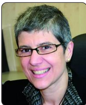
Candela Calle Directora general del Instituto Catalán de Oncología (ICO)

R. Somos una empresa pública del CatSalut, monográfico de atención en el cáncer. Atendemos el 40 por ciento del cáncer de Cataluña, y en ese sentido estamos organizados orientados al paciente, con una mirada integral, y nos organizamos en unidades funcionales. A partir del momento en