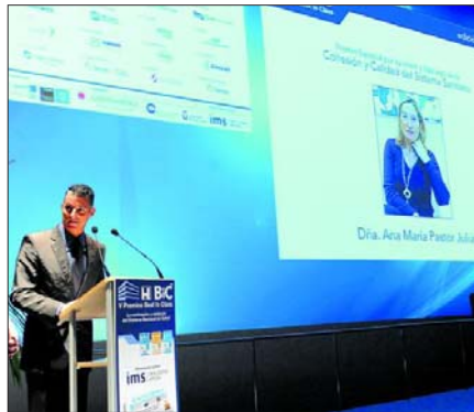
Durante la gala se reconoció a Ana Pastor, coordinadora de Política Social del PP y ex ministra, su liderazgo en la cohesión y calidad del SNS.