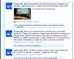
Premios BiC en Facebook ha sido una novedad de esta edición.

La gala de los Premios Best In Class (BiC) no solo fue seguida por los 450 asistentes al Palacio de Congresos y Exposiciones de Galicia en Santiago de Compostela. Varios cientos de personas visitaron a lo largo del pasado miércoles la página de Facebook de los premios BiC ( www.facebook.com/PremiosBiC2010 ), novedad de esta edición, para seguir la retransmisión que la redacción de GACETA MÉDICA realizó en directo con el objetivo de dar la mayor difusión inmediata a la hora de desvelar los ganadores en cada una de las categorías convocadas.