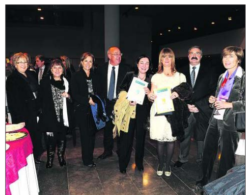
El equipo del Complejo Universitario Asistencial de Salamanca, que recibió los premios al Mejor Hospital y Mejor Servicio de Hematología y Hemoterapia.