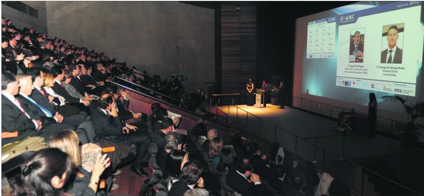
El Palacio de Congresos y Exposiciones de Santiago de Compostela congregó a más de 450 personalidades, entre autoridades sanitarias de diferentes comunidades, equipos de los hospitales finalistas y premiados, representantes de organizaciones profesionales y altos cargos de la industria farmacéutica.

■ HAN SIDO LOS RECONOCIDOS EN LA V EDICIÓN DE LOS BEST IN CLASS (BiC) QUE PREMIA LA CALIDAD EN LA ATENCIÓN AL PACIENTE